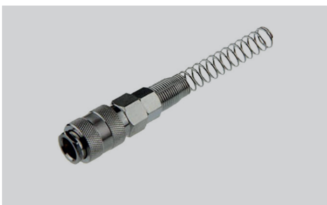
TOMADA RÁPIDA COM MOLA