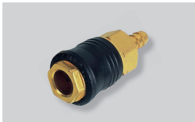
TOMADA RÁPIDA - TUBO COM PROTEÇÃO