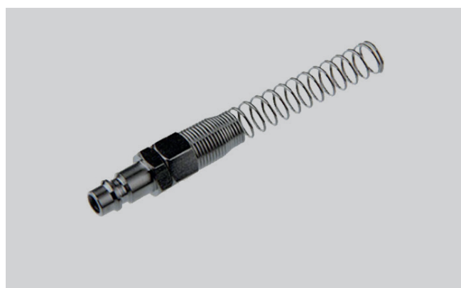
TOMADA RÁPIDA TUBO COM MOLA