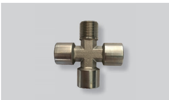
CRUZETA 3F + 1M